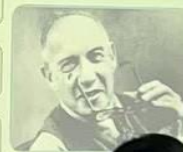
Peter F. Drucker